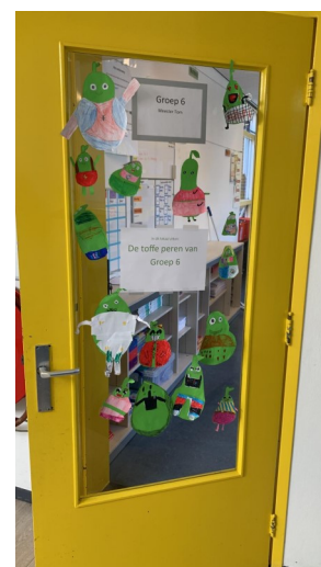
In groep 6 zitten allemaal toffe peren.