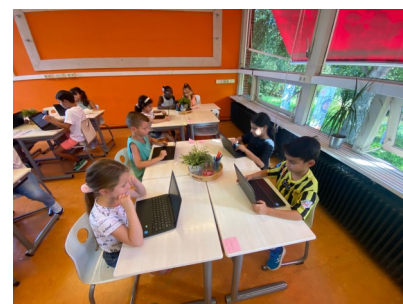
De kinderen van groep 4 werken voor het eerst met een chromebook.

U kunt voor vragen altijd ook zelf contact opnemen met de schoolmaatschappelijk werkster, het wijkteam en natuurlijk de intern begeleiders van de MMK (Stephanie Blomsteel voor de Beestenboel en de groepen 1-2 en Anke Boelema voor de groepen 3 t/m 8).